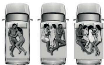
Small Medium Large