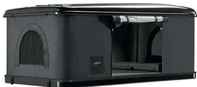
Modell Black Storm Farbe schwarz / carbon