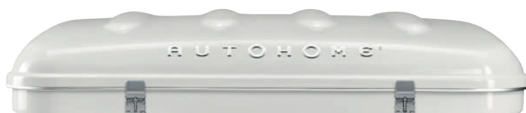
Dachzelt Airpass 360 weiß / carbon