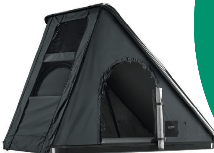
Modell Black Storm Farbe schwarz/carbon

Material Dachschaale GFK, Zelttuch 100 % Polyester (mit Acrylatbeschichtung).