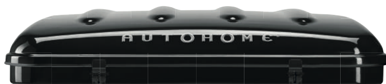
Dachzelt Airpass 360 schwarz / carbon